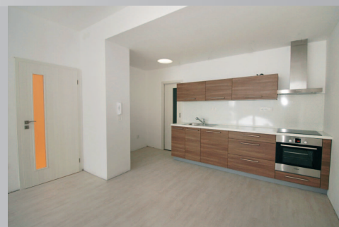
RD Žabovřesky, Haasova 8