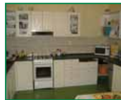
RD 5+1, Jinačovice Brno-venkov, Jinačovice RD 5+1, 474 m 2 zast. plocha a dvorek, 118 m 2 zahrada. Řadový RD ve tvaru písmena U s dvorkem uprostřed a zahradou za domem, po rekonstrukci, zateplení, nové rozvody, omítky. 3 700 000 Kč ☎ 775 187 934