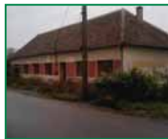
RD, 2+1 a 4+kk, zahrada, Unín Brno-venkov, Unín, prodej RD, 2 bytové jednotky 2+1 a 4+kk. v domě nutno dokončit rekonstrukce vnitřních prostor, nová okna euro, rozvody topení v mědi, voda plast. Součástí je dvůr a zahrada. 2 700 000 Kč ☎ 724 151 452