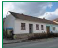
RD 3+1, Bilovice nad Svitavou Okres Brno - venkov. Prodej RD 3+1, Bilovice nad Svitavou. Jedná se o starší dům po částečné rekonstrukci. Celková výměra pozemku je 446 m 2 . Možnost půdní vestavby nebo komerčního využití. 3 250 000 Kč ☎ 725 640 083