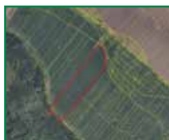
Stavební pozemek, Kuřim okr. Brno-venkov, Kuřim. Prodej stavební parcely o celk. výměře 22 453 m 2 , šířce 68 m. Pozemek je v návrhu územního plánu obce jako plocha k zastavbě pro rodinné domy. Sítě jsou v dosahu cca 300 m. 1 200 Kč/m 2 ☎ 602 523 215