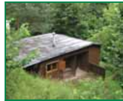
Chata, Ochoz u Brna Okr. Brno - venkov, prodej dřevěné chaty mezi obcí Ochoz u Brna a Kaničemi. Obyvatel část s kuch. koutem + 1 místnost jako ložnice. IS: el. 220V, společná studna. Zast. pl. 29 m 2 . Pozemek je obecní. 250 000 Kč ☎ 602 523 215