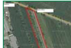
St. pozemek, Újezd u Brna Okres Brno-venkov. Prodej stavebního pozemku ke komerčnímu využití v k.ú. Újezd u Brna, o výměře 2230 m 2 . IS: El, plyn, vodovodní řád cca 30 m od pozemku. Šířka 20 m. 800 Kč/m 2 ☎ 725 640 083

STP, Popovice u Brna, 11 500 m 2 Brno-venkov, Popovice u Rajhradu prodej pozemků o celkové výměře 11 500 m 2 . Na pozemcích je uvažováno o komerční výstavbě (kanceláře, sklady a podobně ). 800 Kč/m 2 ☎ 725 702 548