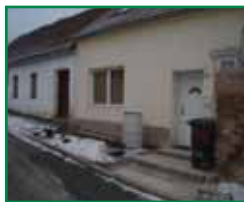
RD 3+1 Neslovce Okres Brno-venkov, Neslovce, RD 3+1, zast. plocha 83 m 2 , užitná plocha 75 m 2 , dvorek 23 m 2 . Kompletní rekonstrukce 2005. Dům je vytápěn krbem s průduchy do všech obytných prostor + přímotopy. 1 920 000 Kč ☎ 775 187 934