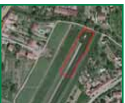
STP 2 301 m 2 , Želešice u Brna Okr. Brno - venkov, Želešice u Brna. Stavební pozemek 2 301 m 2 o šířce cca 20 m. IS cca 100 m od pozemku. Pozemek je na rovině a je možné rozparcelovat na 2-3 díly. Dobrá a rychlá spojení s Brnem. 1 400 Kč/m 2 ☎ 725 702 548

Bilovice nad Svit. STP 8 336m 2 Okr. Brno venkov, Bilovice nad Svitavou. Pozemek vhodný k výstavbě rodinných domů v žádané lokalitě blízko Brna se všemi sítěmi na hranici pozemku. Klidná, pěkná část obce s výborným spojením - IDS. 1 700 Kč/m 2 ☎ 725 702 548