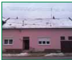
RD 3+1, Vranovice nad Svratkou Brno-venkov, Vranovice nad Svratkou, RD 3+1. Pokoje 20 m 2 , 12 m 2 , 25 m 2 , kuchyň 15 m 2 , chodba, komora. Koupelna s vanou a WC společně. Garáž, dvorek, dílna a sklep. Z přední strany RD plastová okna. 1 500 000 Kč ☎ 773 617 705