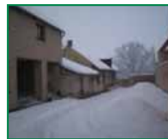
Pronájem haly 128 m 2 , Modřice Brno-venkov, Modřice pronájem komerční haly 128 m 2 vhodné pro sklad, komplet. výrobu, lehkou nehlukovou výrobu. Hala je vytápěná, el. obojí. Vjezd výška 3,5 m, park. ve dvoře. 9 000 Kč/měs. ☎ 724 151 452

Hledáme ke koupi byt v Brně. Ve středu města. Na velikosti nezáleží. Pokud možno balkon.