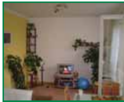
Byt OV 3+kk 64 m 2 , Tišnov Brno-venkov, Tišnov, byt 3+kk 64 m 2 , přízemí s terasou 12 m 2 , součástí je sklepní kóje. Okna plast, podlahy lino a dlažba, sítě kompletní mimo plynu. Zůstává kuchyňská linka včetně spotřebičů. 1 800 000 Kč ☎ 724 151 452