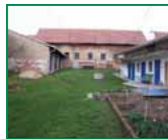
Pronájem stodoly, Kovalovice Okres Brno-venkov, obec Kovalovice, pronájem skladových prostor v prázdné stodole o rozloze 180m 2 . Uzavřený dvorek s vjezdem z ulice - 2 zastřešená stání. Průjezdnost vrat: v.275cm, š.290cm. 6 000 Kč/měs. ☎ 773 617 705