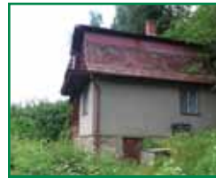
Chata 2+1 s verandou, Nedvědice Okres Brno - venkov, Nedvědice. Prodej zděné chaty 2+1 s prosklenou verandou. Zastavěná plocha 50 m 2 , zahrada 727 m 2 . Zavedena elektřina, topení na tuhá paliva, voda pouze užitková, pitná studánka. 800 000 Kč ☎ 775 187 934