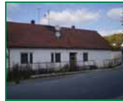
RD 3+1 se dvorem, Mokrá Brno-venkov, Mokrá u Brna, prodej RD 3+1. Vystavěn z pálené cihly. Součástí je dvůr s přístupem z ulice, hospodářská místnost, udrna, prosklená veranda a malý sklep. Z čelní části jsou plastová okna. 1 100 000 Kč ☎ 724 151 452