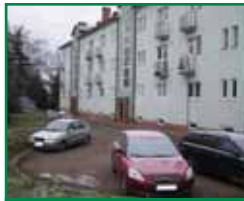
Byt 2+1, Kuřim, Bezručova Brno-venkov, starší byt 2+1, plocha 70 m 2 , vhodné na investici - je zde věčné břemeno užívání. Klidná lokalita, dobrá dostupnost, před domem je park s vyžitím pro děti. Náklady na byt jsou 1.626,- Kč. 600 000 Kč ☎ 725 640 083