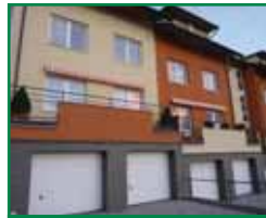
Byt 2+kk, Bilovice nad Svitavou Brno-venkov. Novostavba bytu OV 2+kk, 69 m 2 a balkon 4,5 m 2 , 2x parkovací stání 24 m 2 , výtah, obložkové zárubně, plovoucí podlahy, dlažba, vlastní plynový kotel. Kuch. linka včetně el. spotřebičů. 2 500 000 Kč ☎ 725 640 083