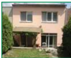
RD, zahrada a garáž, Šlapanice Brno-venkov, Šlapanice prodej domu se zahradou a garáží, celková plocha 219 m 2 . Dům má 3 podlaží, užitná plocha 300 m 2 . Sítě kompletní. Dům byl kolaudován v roce 1997. Venkovní posezení, bazén. 3 800 000 Kč ☎ 724 151 452