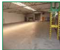
Pronájem skladu 420m 2 , Modřice Brno - venkov. Modřice. Pronájem vytápěného skladu 420 m 2 , výška 3,5 m. Kanceláře a soc. zázemí. Možnost parkování v areálu. 45 000 Kč/měs. ☎ 725 640 083